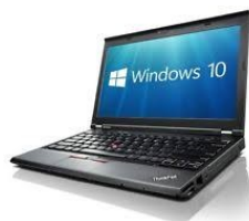
Ordinateur , Windows 10