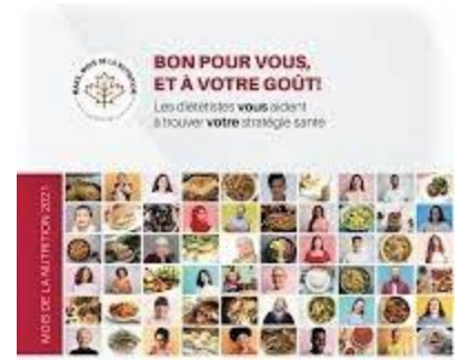
Affiche mois de la santé mars 2021