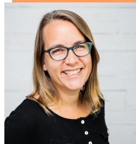
Sophie La Beaume