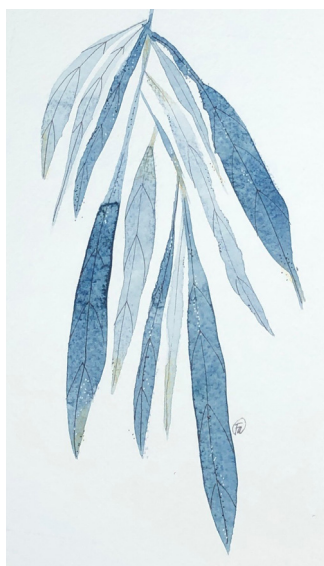
Francine André Feuillage série bleue (1 de 4)