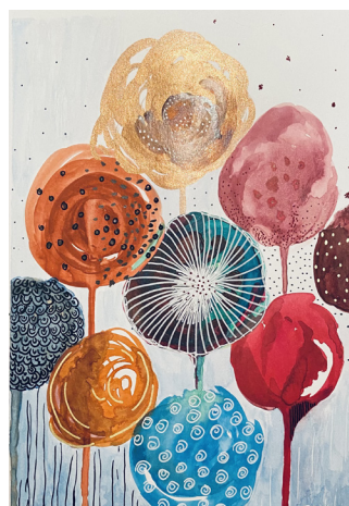
Guylaine Ducharme Des fleurs comme des bonbons