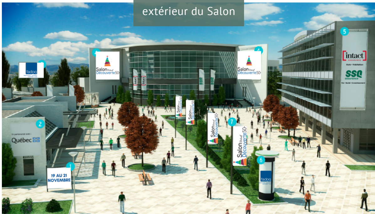
extérieur du Salon