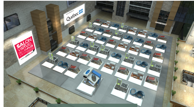
intérieur du Salon