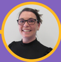
Agente des communications et des services virtuels