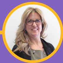
Coordinatrice des activités