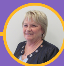
Agente au membership