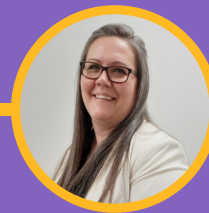
Agente à l'accueil