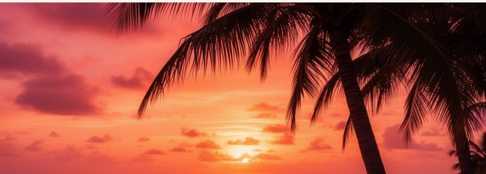
Coucher de soleil sur les Caraïbes