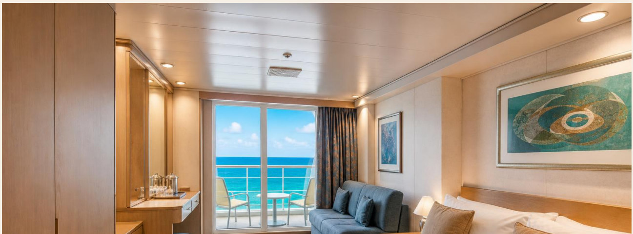
Cabine balcon à bord du MSC OPERA.

Conditions d'annulation : Pour un voyage de groupe forfaitisé, le dépôt est non remboursable ainsi que le paiement final. Si vous annulez votre participation, les montants payés de votre part serviront à maintenir la viabilité financière du forfait groupe.